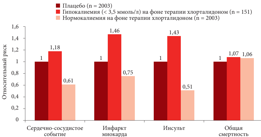
Исследование SHEP: относительный риск развития сердечно-сосудистых событий на фоне терапии хлорталидоном в зависимости от уровня калия плазмы (относительный риск сердечно-сосудистых событий в группе плацебо принят за 1)